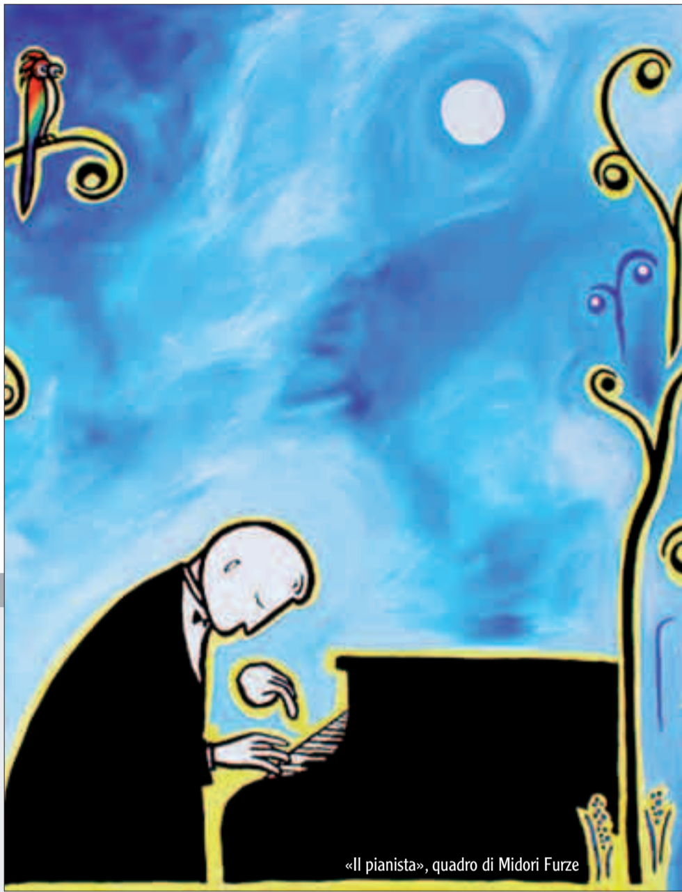
«Il pianista», quadro di Midori Furze

discorso è in primo luogo metaforico, cifra di un'eccedenza ora numinosa ora perturbante, segno di un altrove e di un oltre che la prosa dell'autrice solo addita senza pretendere di forzarne/usurparne i confini. I personaggi stessi nella loro didascalica vocazione emblematica - da una parte i malati, dall'altra i cosiddetti sani - sono appena attori di un dramma che vuol testimoniare in primis della porosità di ogni limite: fra pazzia e saggezza, arte e abbaglio illusorio, emarginazione e carità, gioia ed affanno. Questo forse è il pregio maggiore di un racconto assai godibile, ben narrato e poeticissimo, che con estremo senso della misura sa trattenersi sulla soglia del mistero e dell'indicibile additandoci tuttavia, al di là della ragione, della concretezza e del giorno, gli orizzonti onirici, fantasiosi ed irrazionali che costituiscono il lato oscuro e abissale dell'animo umano e che fatalmente ci appartengono.